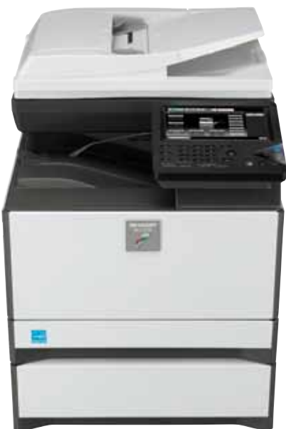
Imagen con la bandeja de papel opcional

CONÉCTESE A LA NUBE CON LA OPCIÓN SHARP OSA