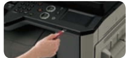
Puertos USB para imprimir directamente desde un lápiz de memoria