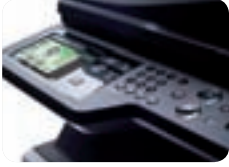
Pantalla LCD en color