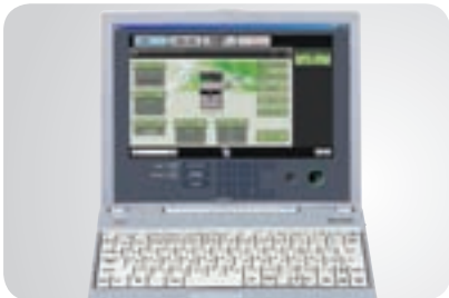
Panel de control de acceso remoto

La MX-2310U es potente a la vez que versátil, y además fácil de manejar. Cada configuración importante se puede configurar desde una página web propia. Con un vistazo a la pantalla de estado del trabajo dentro del panel de control mostrará, por ejemplo, todos los trabajos de copiado e impresión y su posición dentro de una cola. Pero eso es solamente una idea ingeniosa. Otras innovaciones de fácil utilización incluyen: