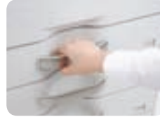
Asas sencillas en la bandeja