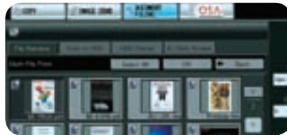
La vista con pestañas le permite el control