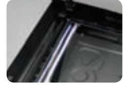
Luces LED de bajo consumo