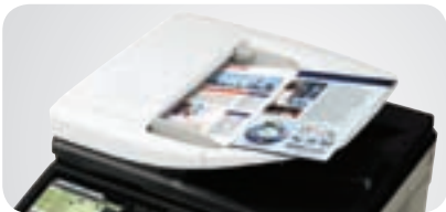
Alimentador Reversible de Paso Único de 100 hojas

Todo esto lo convierte en una MFP compacta pero sorprendentemente versátil que aumentará la productividad de todo el equipo.