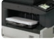
Finalizador interno que ahorra espacio