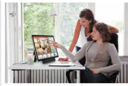
DISCUSIONES VISUALMENTE ENRIQUECIDAS