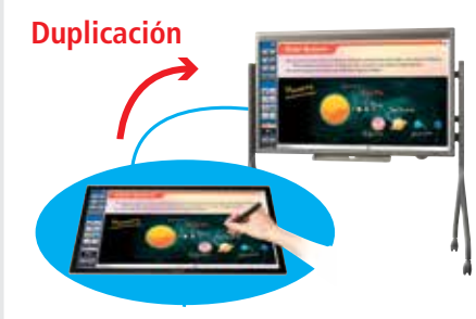
CONECTIVIDAD CON BIG PAD