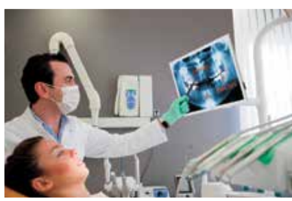
SERVICIOS MÉDICOS Y CONSULTAS*