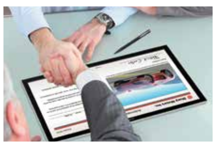
NEGOCIACIONES CARA A CARA