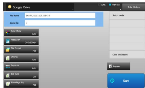
Escaneo de datos en Google Drive

Las MX-4070N/3570N/3070N soportan no sólo el acceso a Sharp Cloud Portal Office, sino que también tienen acceso directo a servicios en la nube como SharePoint® online, OneDrive® y Google® Drive. Los usuarios acceden a los servicios cloud directamente, almacenando datos escaneados y/o imprimiendo datos almacenados en el servicio de cloud.